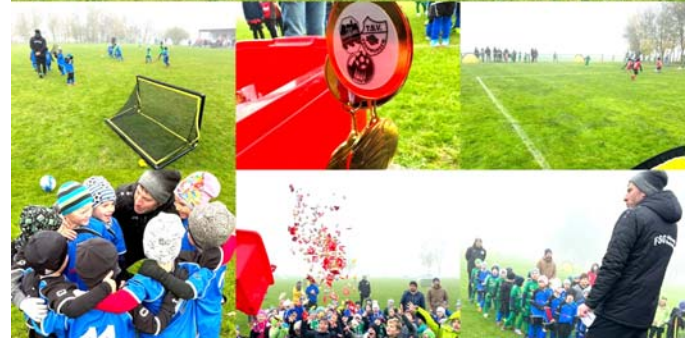
Am vergangenen Samstag fand in Mündling das letzte Minifußball-Turnier der Bambini statt. Vielen Dank an die Trainer um Torsten Krämer sowie an die zahlreichen Helfer vor, während und nach dem Turnier.