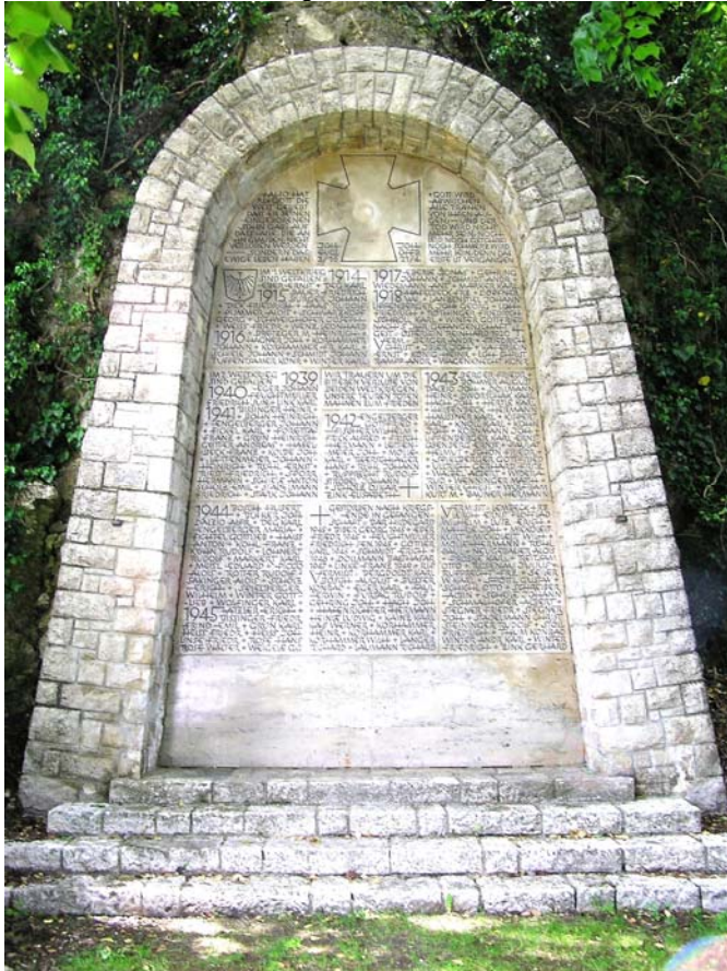
Text u. Foto: HI.

Die Mahnung zum Frieden wurde im Jahr 1962 eingraviert, als die Gefahr eines atomaren Weltkriegs in Kalten Krieg zwischen Ost und West drohte. Wenn sechzig Jahre später am diesjährigen Volkstrauertag wieder an die Opfer der Weltkriege erinnert wird, hat die Mahnung nichts an Dringlichkeit verloren.