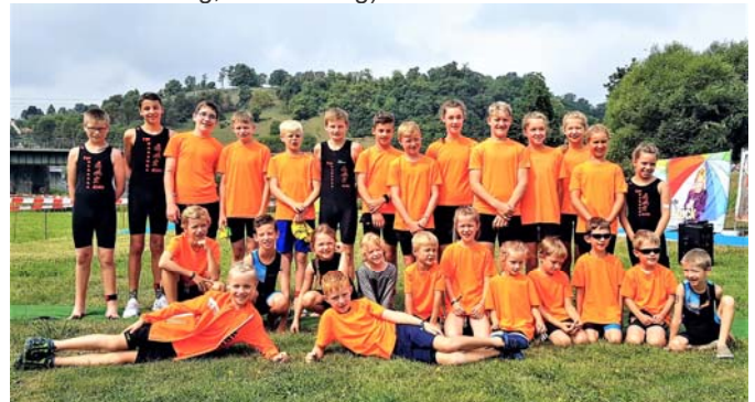
Bild zeigt die Harburger TriaKids