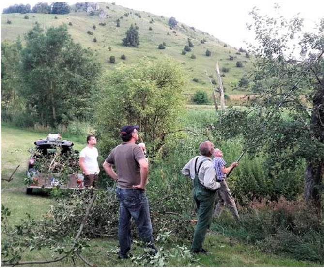
Mit Elan „verjüngten“ Sommerschnittkursteilnehmer einen in die Jahre gekommenen Apfelbaum an der Wörnitz.