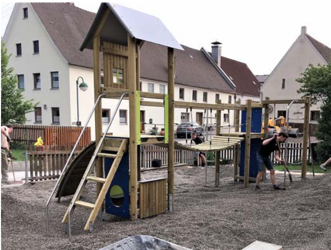
Die Eltern beim Verteilen des Kieses

Die letzte Herausforderung waren dann noch die 50 Tonnen Fallkies, die größtenteils per Hand um das Klettergerüst verteilt werden mussten.