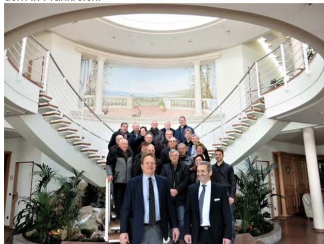
Der Eingangsbereich der Firma Fendt-Caravan ähnelt einem Kreuzfahrtschiff.

Abschließend noch etwas Überraschendes: Den größten Umsatz generiert Fendt-Caravan nicht in den Niederlanden, sondern in Frankreich.