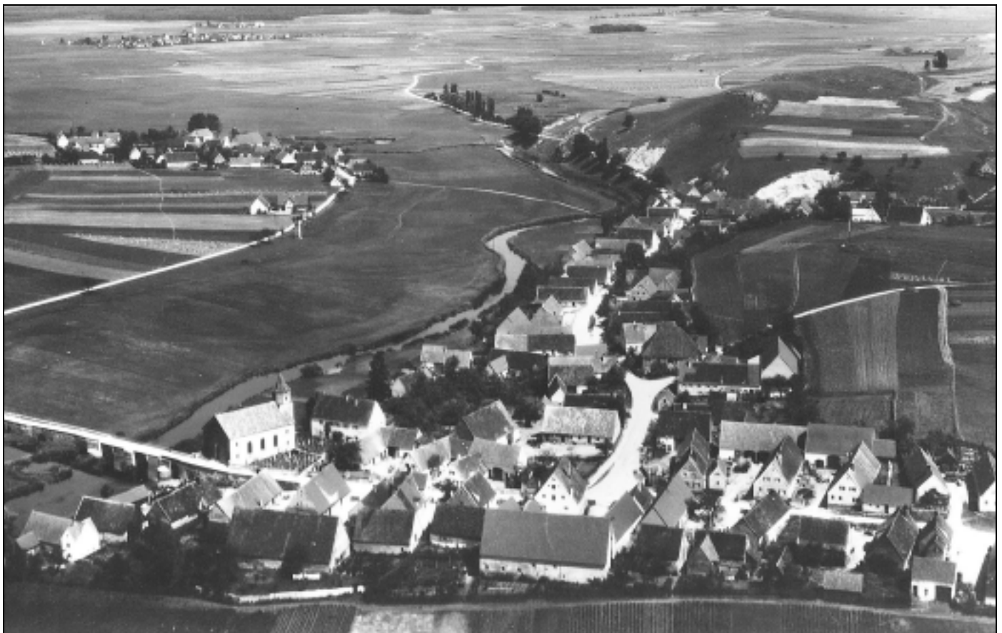
Heroldingen und Schrattenhofen – aufgenommen am 8. August 1933

6. Redaktionsschluss: Jeweils Montag, 16.00 Uhr, für die Ausgabe in der gleichen Woche. Abweichungen werden möglichst rechtzeitig bekannt gegeben.