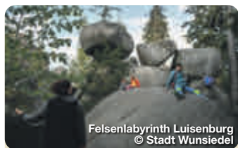
Felsenlabyrinth Luisenburg