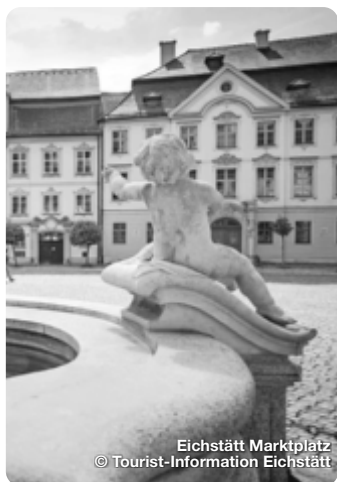
Eichstätt Marktplatz