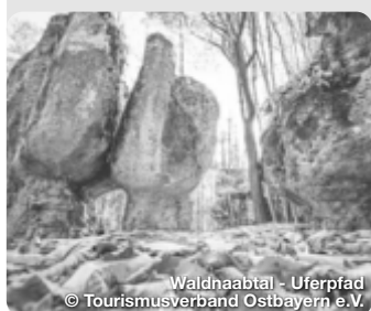
Waldnaabtal - Uferpfad

Herrlich entspannte Urlaubstage genießen im Naturpark Altmühltal. In sanften Kurven schlängelt sich die Altmühl durch eine Landschaft, die ideal ist für Aktive und Naturgenießer. Vorbei an Jurafelsen und sonnigen Wacholderheiden fahren Radwanderer auf einem der beliebtesten Radwege Deutschlands, dem Altmühltal-Radweg. Auf 166 Kilometern folgt er dem Fluss von Gunzenhausen aus durch den Naturpark Altmühltal bis zur Donau in Kelheim. Der Altmühltal-Radweg ist eine fabelhafte Route für Genussradler: naturnah, eben und stressfrei fernab des Straßenverkehrs. Der perfekte Weg für entspannte und entspannende Wanderungen im Naturpark Altmühltal ist der Altmühltal-Panoramaweg. TreffpunktDeutschland.de/altmuehltal