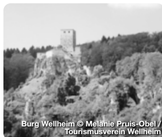
Burg Wellheim

Das Urdonautal rund um Wellheim, über dem weithin sichtbar die majestätische Burgruine thront, liegt als Ausläufer des Altmühltals zwischen Eichstätt und Neuburg/Donau. Es gehört zu den 100 schönsten Geotopen Bayerns und ist mit zahlreichen gut ausgeschilderten Wanderwegen ein tolles Ausflugsziel für alle Naturliebhaber. Hier entspringt die Schutter, die sich durch das romantische Tal bis nach Ingolstadt schlängelt. Auf dem zertifizierten Qualitätswanderweg Urdonautalsteig finden Sie ein ganz besonderes Wandererlebnis durch Wälder, über Trockenrasenhänge und vorbei an beeindruckenden Felsformationen mit vielen spektakulären Aussichtspunkten sowie Kultur- und Natursehenswürdigkeiten. TreffpunktDeutschland.de/wellheim